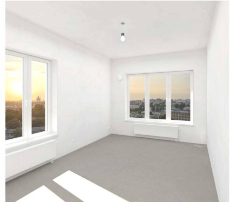
Квартиры с отделкой White Box или без отделки (в зависимости от выбранного дома)