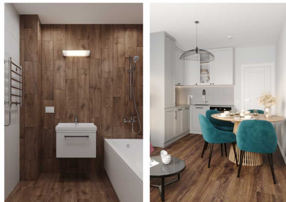
Квартиры с отделкой Comfort Wood