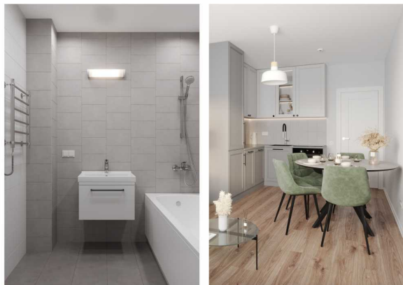
Квартиры с отделкой Comfort Stone